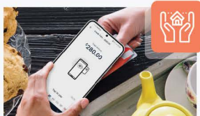
Persona que trabaja desde casa