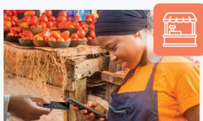
Pop-up tienda / mercadillo semana