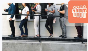
Cola de cobro