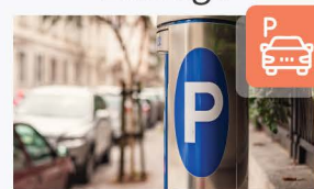
Aparcamiento en fila