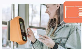
Tiquete y transporte público