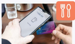
Restaurante y Bar