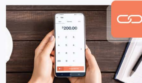
Offline to online